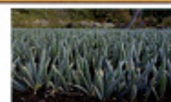
下仁田ネギ(下仁田町)