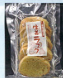
生姜ラスク 250円 HOSOYA/パウダーエッジ ニアリング【伊勢崎市】