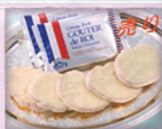
グーテ・デ・ロワ/ホワイトチョコレート 簡易大袋 10枚入 735円(税込み)