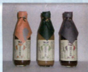
かっぱの焼肉のたれ 924円 いいでや【富岡市】