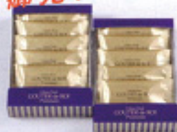
グーテ・デ・ロワ/プレミアム 簡易箱 5枚入 683円(税込み)

※グーテ・デ・ロワ簡易小袋【16枚入(2枚入×8袋) 608円(税込み)】と簡易大袋【26枚入(2枚入×13袋) 945円(税込み)】も販売します。 ※12月は3日(土)、4日(日)を予定。原則として第1土曜・日曜日に販売します。