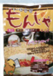
いせさきもんじゃ(2人前) 500円 梅田製作所(梅田 屋)【伊勢崎市】