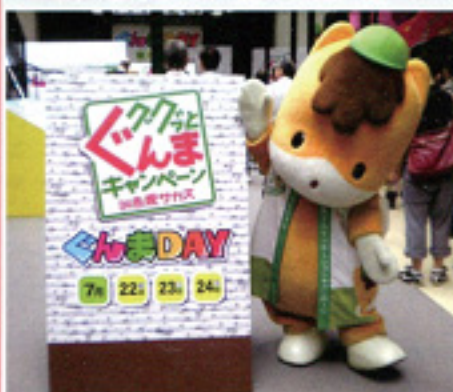
(ぐんまちゃんブログ http://plaza.rakuten.co.jp/machi10gunma/ )

平成6年に誕生した群馬県のマスコット「ぐんまちゃん」。今年は、大型観光キャンペーンのイメージキャラクターを務めCMに登場したり、電車のヘッドマークになったり、大活躍。デザイン利用件数も増加し、お菓子やグッズ類から工事看板まで、いろいろな所に登場しています。