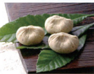
(1個:210円、6個入り:1,470円) (税込み・送料別)