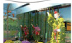
関東菊花大会(みどり市)