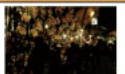
桐生恵比寿講(桐生市)